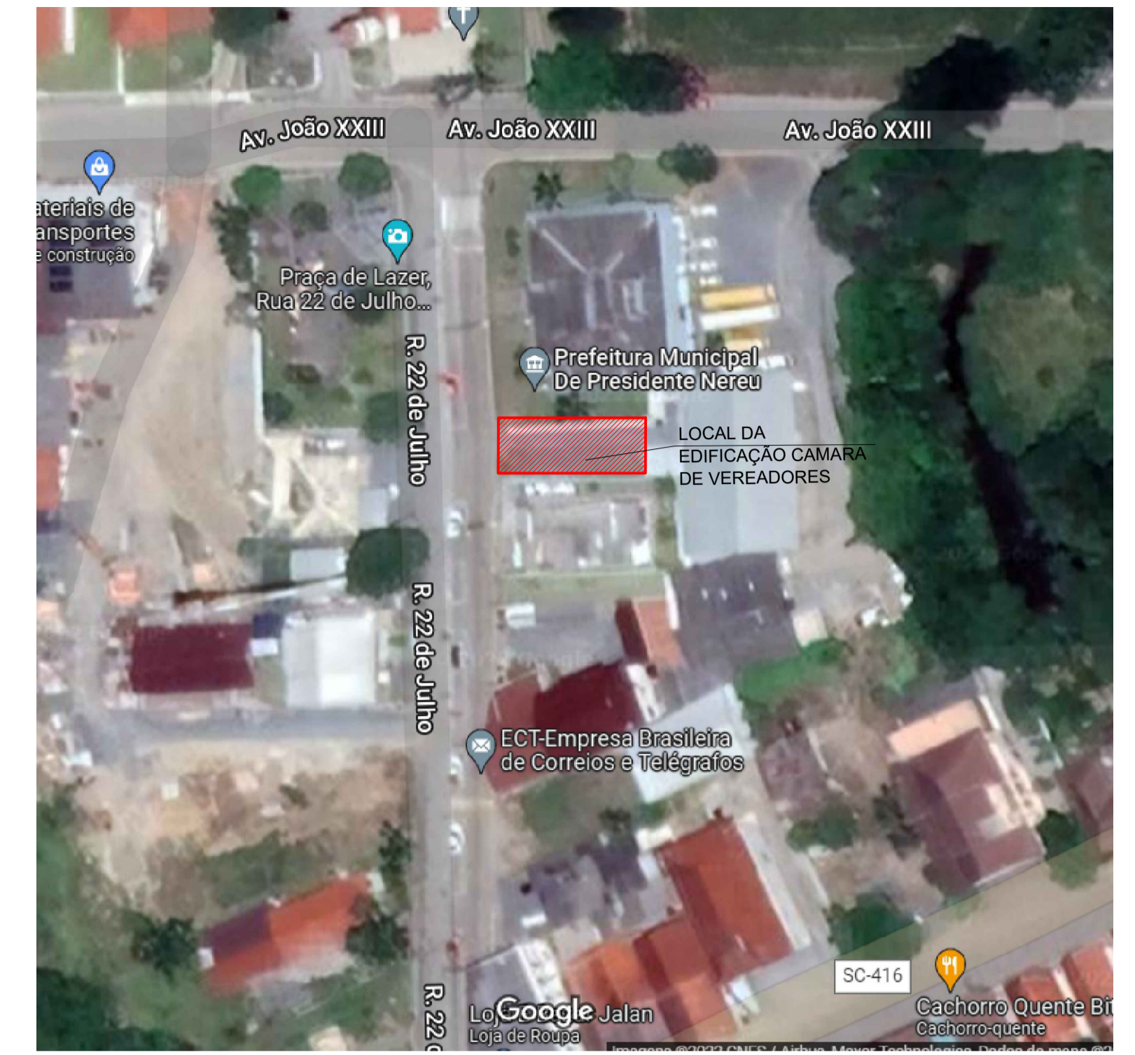
PLANTA DE SITUAÇÃO SEM ESCALA